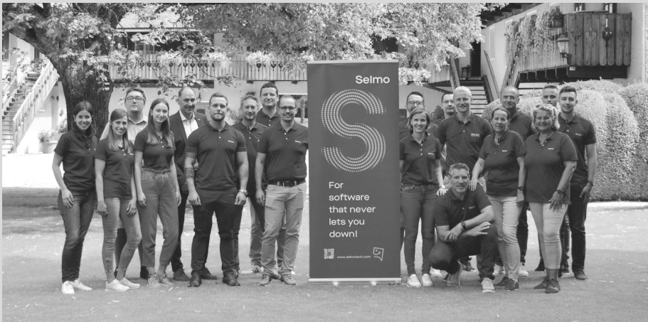
Das Team hinter Selmo Technology besteht aktuell aus 25 Mitarbeitern.